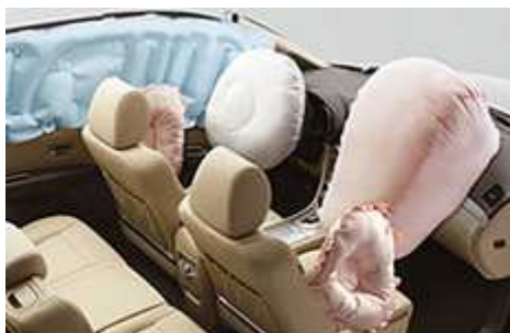
SRS* přední airbagy, přední boční airbagy a stropní airbagy