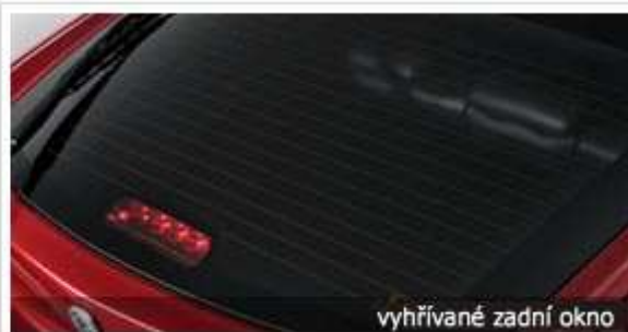
vyhřívané zadní okno